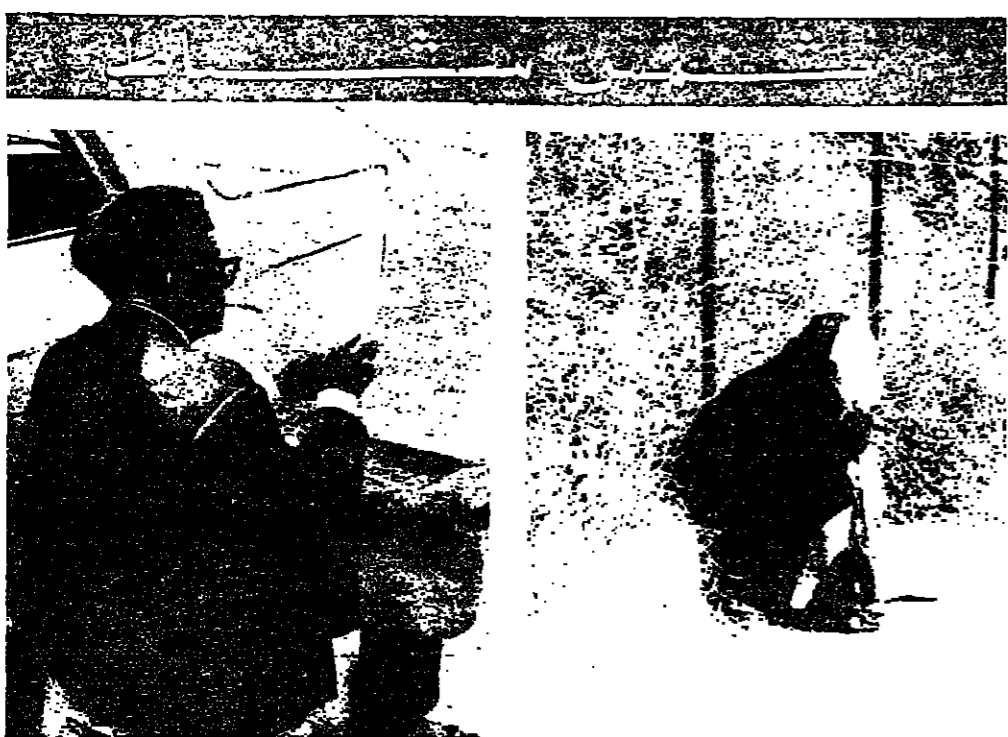
بوتف و سمس شباط ■ سمس شباط انسه نفس الرماد ■ شمس شباط ، نبت الفصح قسي نفوس الجبانز . الكبار والصغار ، هم انصار شمس شباط ، وهم عشاقها .. الصغار يجدون فيها رقيقة ملاعبهم ، والكبار صديقتة المصطبات وقطال الشجر .. انها ينشر الربيع ، وظلمة بومكه المنظر .